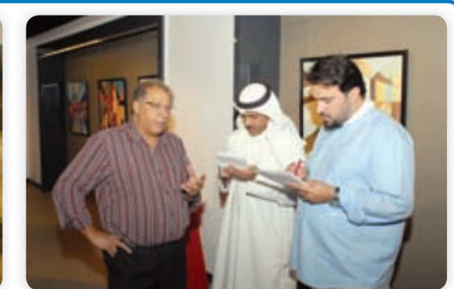
الفنان فاضل العبار يتحدثنا

عبر بإحساس صادق وتدرج لوني رائع عن حركة الحاضر نحو الماضي في معرضه «دار المشرق»