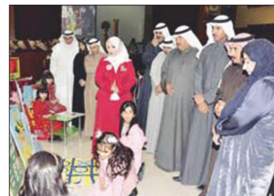
جولة في أركان المعرض