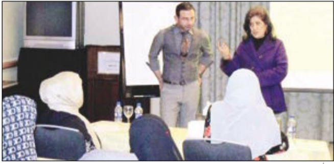
جانب من الورشة الأولى