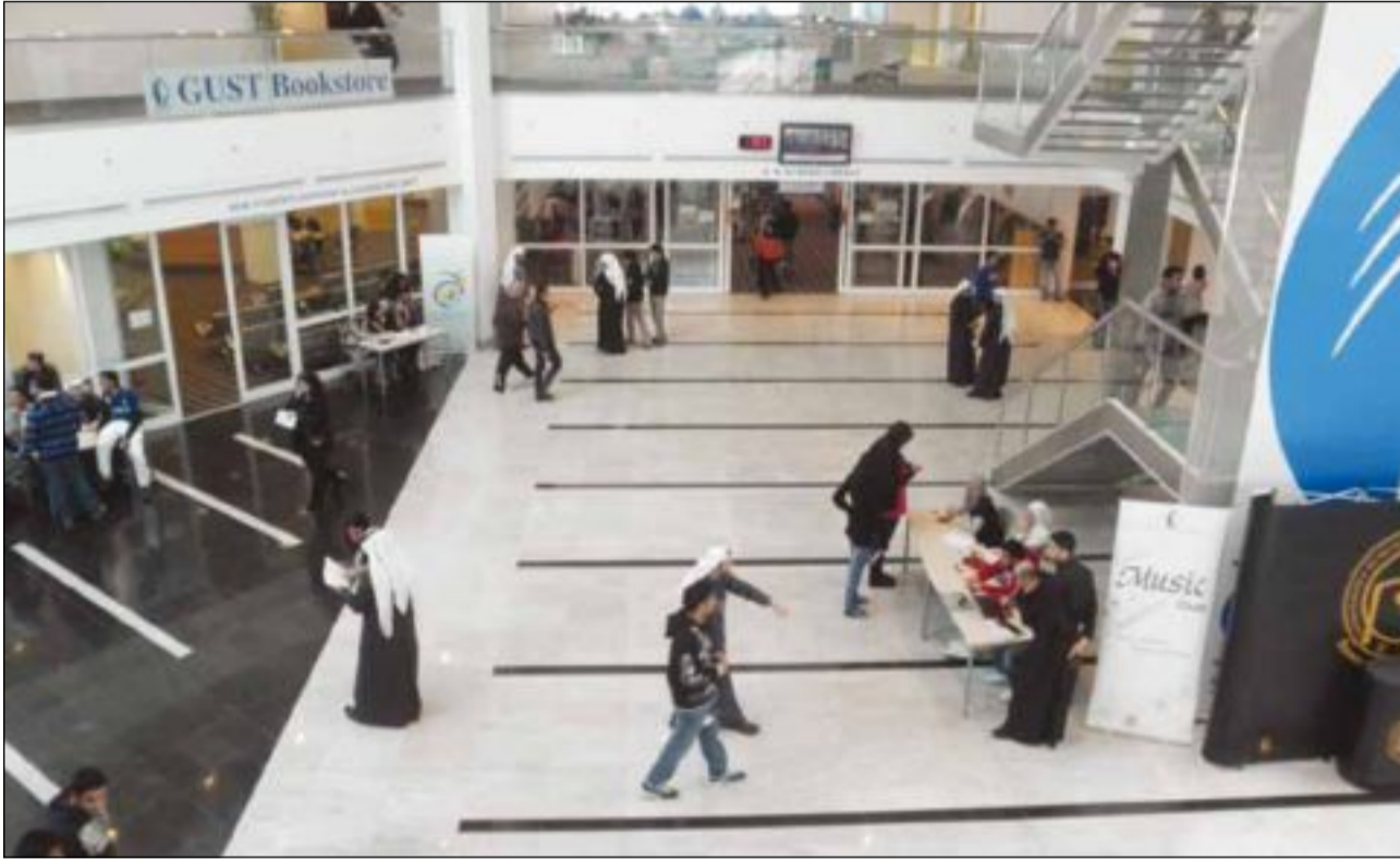
الأندية الطلابية حاجة أم موضة