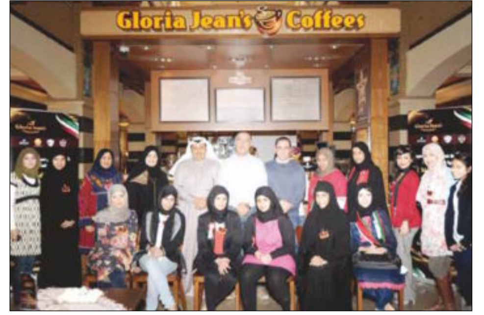
فريق جائزة غلوريا ديزاين

ويوضح الزين أن تزايد عدد الأندية أمر جيد يعزز الجانب الإبداعي لدى طلبة الجامعة، لكن على الأندية أن تكون لها أهداف محددة مع وجود طاقم اداري يسعى لتحقيق الأهداف ويساهم في تقديم عمل متميز ومتجدد دائماً، متنوع التخصصات الموجودة في الجامعة، ويظهر جليا وجود نواذ عديدة تخدم مختلف التخصصات وتعود على طلبة التخصص بالفائدة والمنفعة. ومضى قائلاً: لا يمكن لأي عمل أن يخرج من دون فكرة مميزة وتطبيق رائع يحاكي